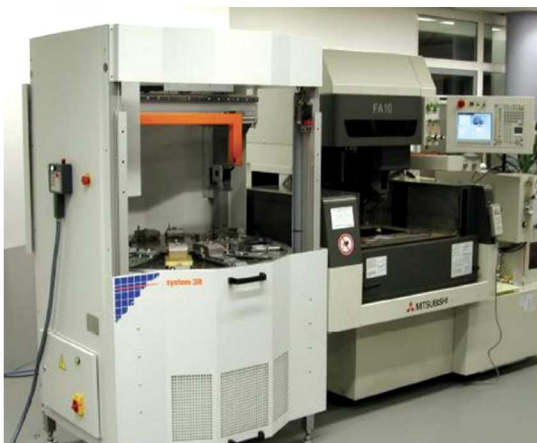
WEDM + 3R WORKPAL COMPACT

가공기의 생산 효율을 높이기 위한 컴팩트형 공작물 자동 교환 장치 WorkPal Compact