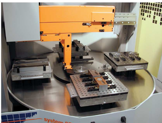
EDM + 3R WORKPAL COMPACT