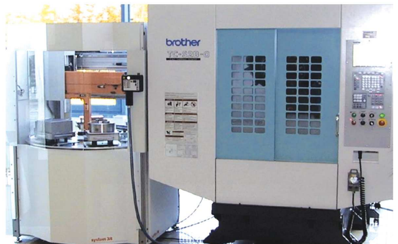
HSM + 3R WORKPAL COMPACT